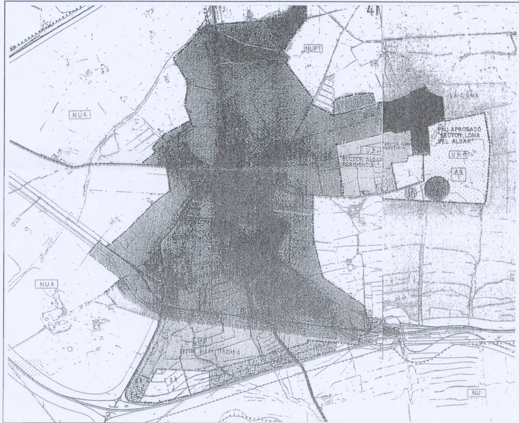
SITUACION -EL ALGAR- E=1/10000