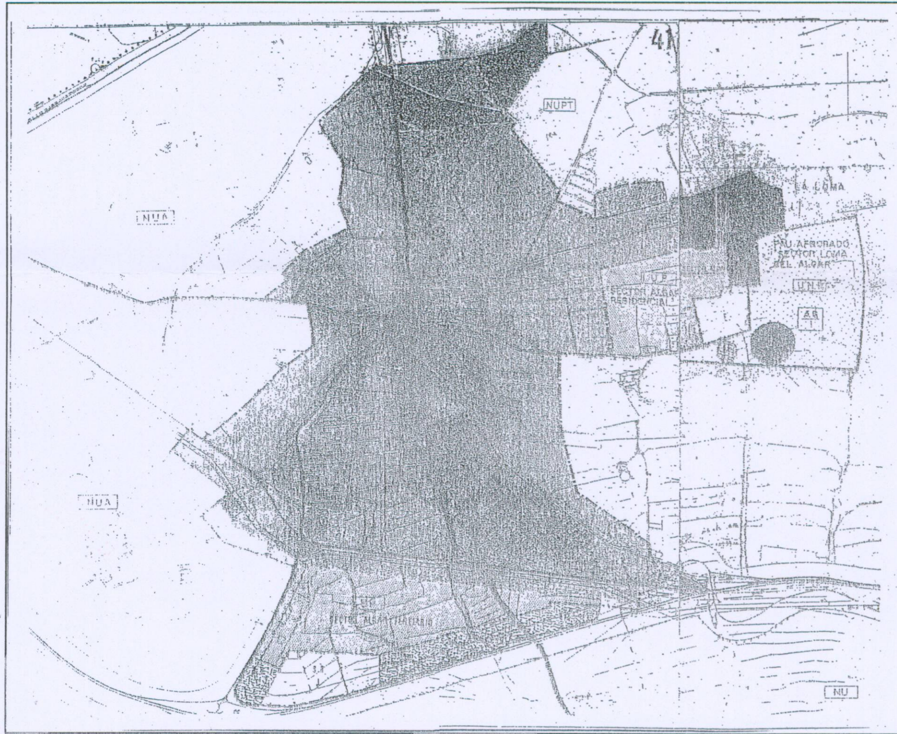
SITUACION -EL ALGAR- E=1/10000