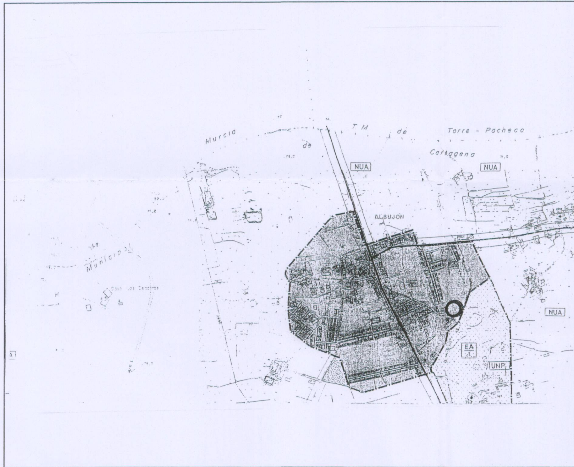
SITUACION —EL ALBUJON— E=1/10000