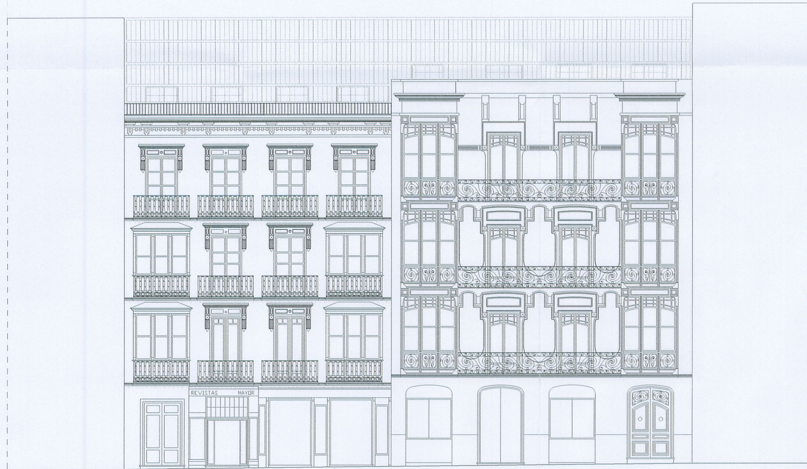
ALZADOS CALLE MAYOR 21 Y 23.-