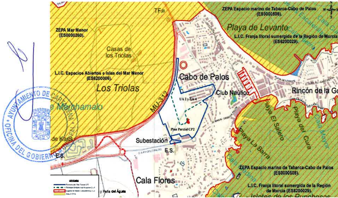
Plano de situación d) Estado actual.

El ámbito de la presente Modificación Puntual no estructural N° 2 del Plan Parcial CP2 se ubica dentro de su perímetro en las unidades de actuación 2 y 4 cuya situación en la estructura orgánica del territorio se expresa en los planos que adjunta a la memoria de modificación.