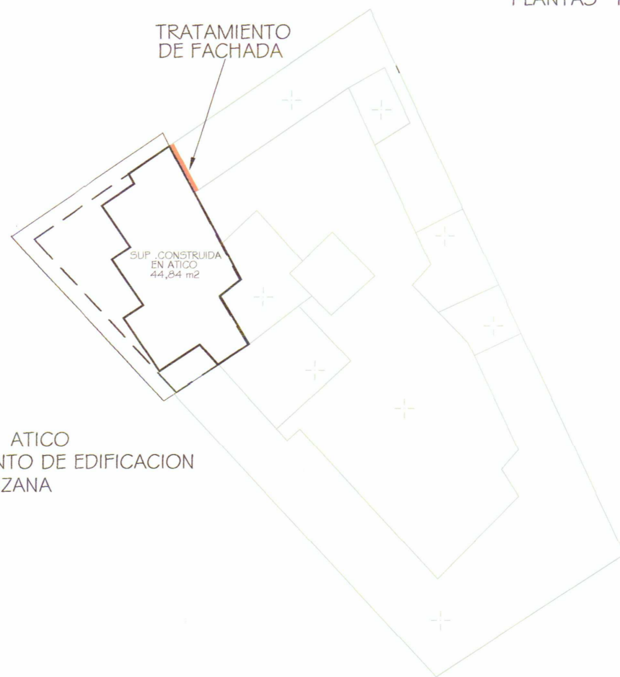
PLANTA ATICO CONJUNTO DE EDIFICACION EN MANZANA

Por acuerdo del Excmo. Ayuntamiento de Gobierno Local de fecha 18.01.08 se aprobó INICIALMENTE el Proyecto de Planeamiento, de cuyo Expediente forma parte el documento en que se consigna presente diligencia. Cartagena, 31.01.08 El Secretario